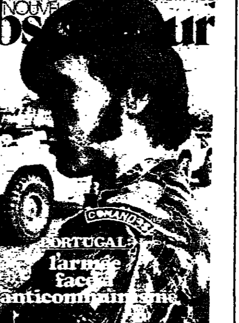
شوية المسكر، غلاف «لونيول» غلاف «الكنيسر»: البروفيسال دانسرة اوبرستور.

قالت جريدة «برانسدا» ان الشعب السوفياتي ينظر بنماطف شديد الى سمي الديمقراطية في الشرق الأوسط، والتوجه الى وحدة في العمل بين حركة الفستوات المسلحة والتشويين والاشتراكيين وكل القوى اليسارية التقدمية التي تسعى الى دعم النظام الديمقراطي العمالي النقائشي في البلاد، والتي الدفاع عن الاجازات السورية للشعب الديمقراطي. وقد اعتبرت قيادة الحزب الاشتراكي في حساباتهم على المسألة الخارجية من قبل اوساط حلف الأطلسي، وودت الرجعية العمالية منذ الأيام الأولى للقوة البرتغالية للتحلل في التشويين الداخلي للبلاد الاخرى، وتطالب بان يقوم البرتغاليون انفسهم بحل المشاكل النقائشة التي يواجهها الشعب البرتغالي. ونشرت «برانسدا» في مقال تقول الوضع في البرتغال يتبع لتطور «العلاق» في البرتغال جاء فيه: ان الأحداث التي تجري في البرتغال تفكر بذلك التي جرت في تشيلي مقيمة الانقلاب النقائشي، لا من حيث اتجاهاتها العمالية للشوعية والديمقراطية فصب، وانما من حيث الطرق التي تستخدمها الحملات الرجعية. وقد تمت الجديدة يسرولية الوقت النقائشي في البرتغال على كاهل قيادة الحزب الاشتراكي هناك، الذين يهدون مع مقالهم من حزب الشعب الديمقراطي في أحداث مثل في اتحاد الشعب والجيوش وفر الوحدة والاتصام في صفوف حركة القوات المسلحة. «وقادة الحزب الاشتراكي في البرتغال الذين يعملون رابطة العمادة للشوعية، والذين اعلموا حريا مكتوفة على القوى النقائشة الحديثة في البلاد.